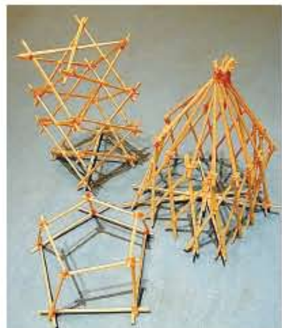
幾何学模様が美しい作品。東京スカイツリーもできる?