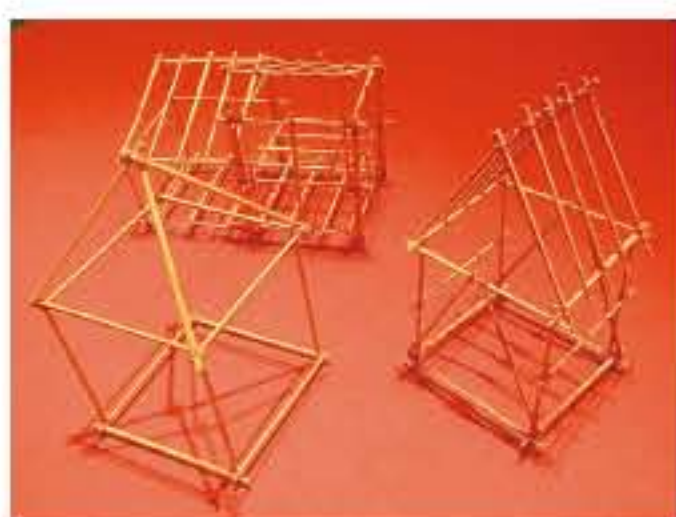
いろいろな家。基本形(左手前)から発展させてみよう