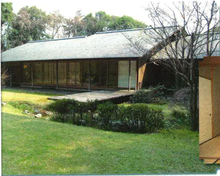
◉ 在来軸組構法の例 (松韻亭)