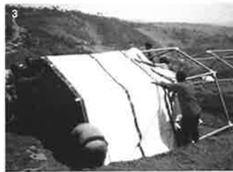
1. 避難所用 紙の簡易間仕切りシステム4/©Shigeru Ban Architects 2. 成都市森林小学校紙製仮設校舎/©Li Jun 3. 国連難民高等弁務官事務所用の紙のシェルター/©Shigeru Ban Architects 4. 紙のログハウス/©Hiroyuki Hirai