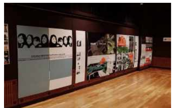
短大生作品（鹿児島県立短期大学）