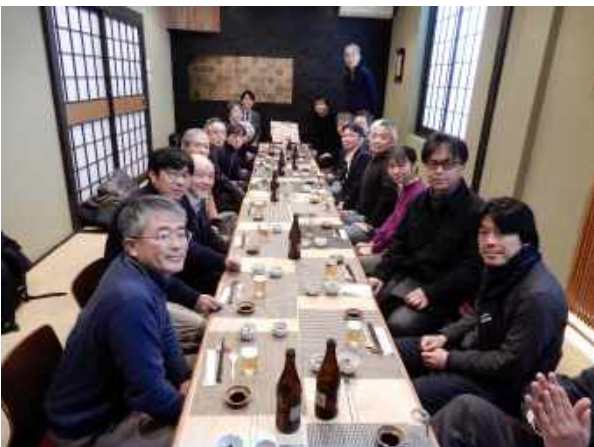
エクスカージョン 昼食風景