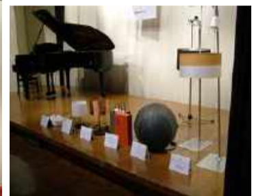
メセナよりの豪華賞品の数々