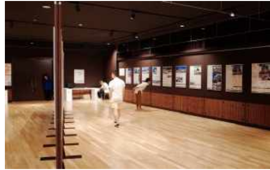
館内の様子（第一工業大学・KIRA全北）