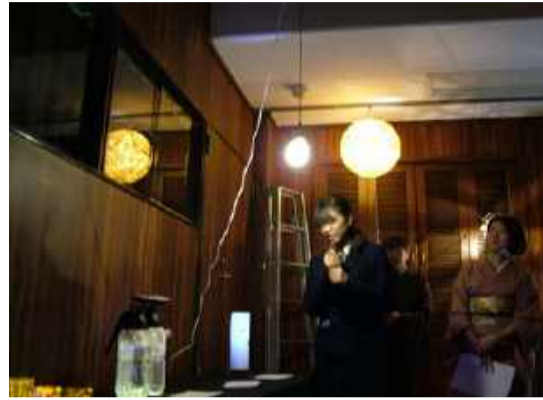
作品の発表・審査