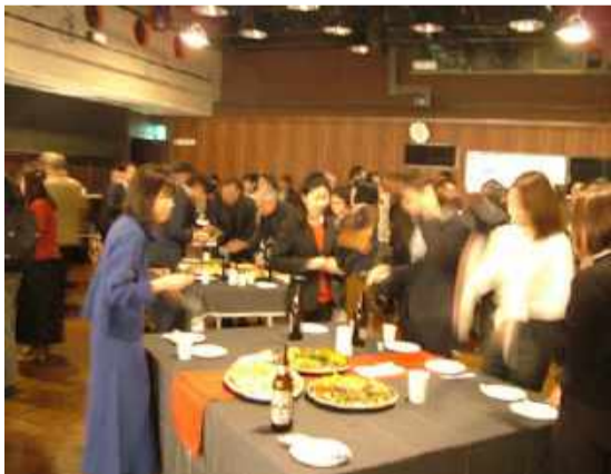
例年より多い来場者、話がはずみました。