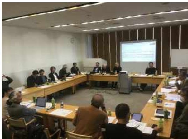
九州支部役員会風景