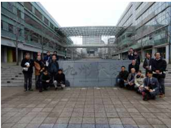
エクスカージョン 九州大学伊都キャンパスで記念撮影