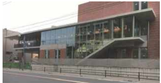
谷山腎クリニック見学会 2020.1.25(Sat)13:30 ~