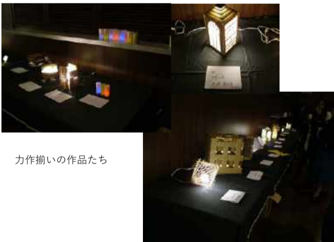
力作揃いの作品たち