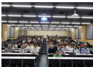
講演会終了後の記念写真

「機能」から始める従来の手法と異なり「材料⇒構法⇒構造⇒形態⇒機能」へと導く手法を熱弁されました