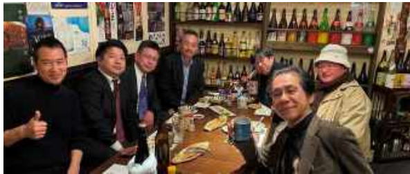
勉強会後の懇親会