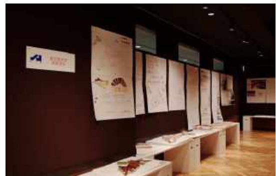
大学生作品（鹿児島大学）