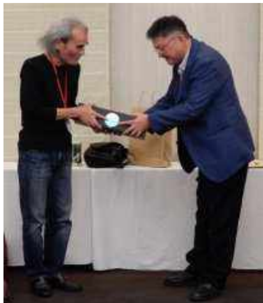
「高崎さんお帰りのない」 記念の焼酎贈呈