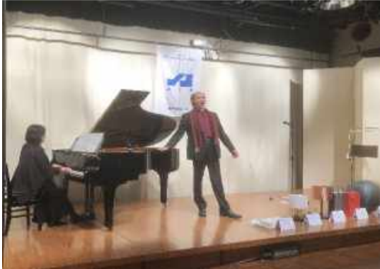
オープニング 八戸ご夫妻による独唱