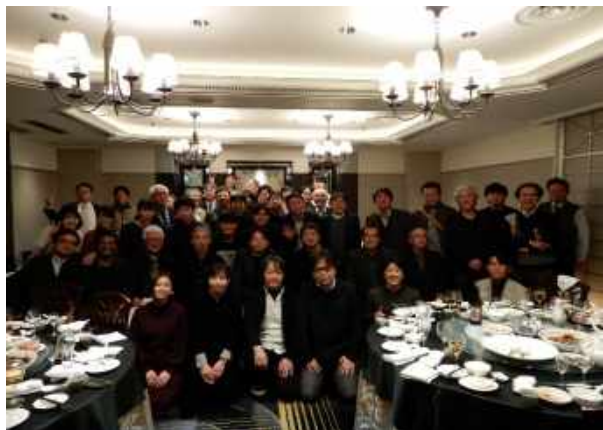
九州支部地域交流会集合写真@ホテルニューオータニ