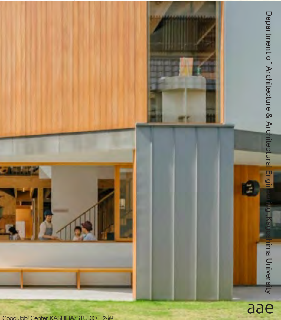
Good Job! Center KASHIBA/STUDIO 外観

2020 熊本県地震震災ミュージアム中核拠点施設整備基本設計プロポーザル最優秀賞 2019 熊野町 東部地域防災センター (仮称) 新築工事プロポーザル最優秀賞 2019 2019 日本建築学会作品選奨・新人賞受賞 (Good Job! Center KASHIBA) 2018 2018 年度 JIA 新人賞受賞 (Good Job! Center KASHIBA) 2018 第2回日本建築設計学会賞大賞受賞 (Good Job! Center KASHIBA) 2017 尾道市御調支所庁舎建設基本・実施設計業務プロポーザル 最優秀賞 2017 グッドデザイン賞 2017 ベスト 100 受賞 (Good Job! Center KASHIBA) 2014 Good Job! センター 設計者選定プロポーザル 最優秀賞 2012 SD レビュー 2012 朝倉賞 (Irony Stations) (共同設計) 2012 新建築賞 (二重螺旋の家) 2011 ベストデビュタント賞 2011