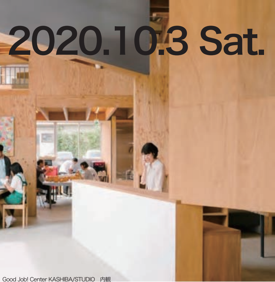
Good Job! Center KASHIBA/STUDIO 内観