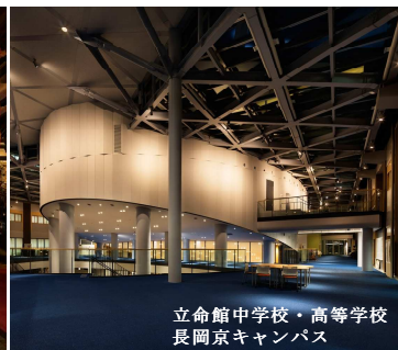
立命館中学校・高等学校 長岡京キャンパス