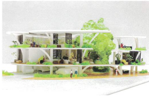
百佑オフィス 模型 (台湾、高雄市、進行中) ※2 ©SUEP.