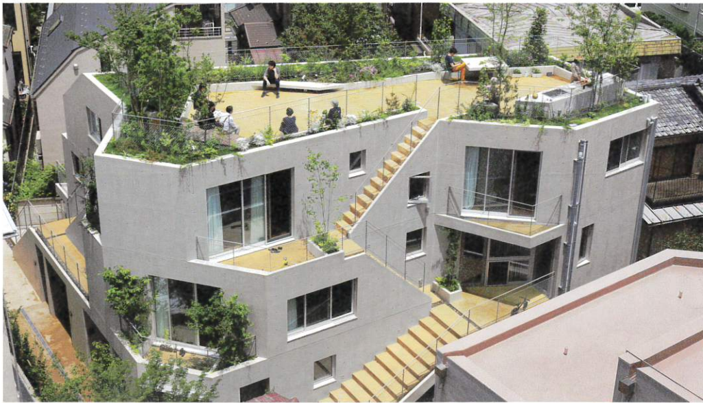
ミドリノオカテラス (東京都、2020年)