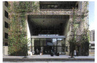
レンゾク今泉テラス (福岡県、2021年) ※1