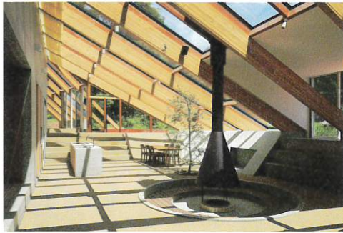
清里のグラスハウス (山梨県、2018年)