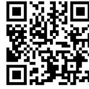
震災ミュージアム公式HP