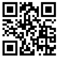
会場案内 (会場公式HP)