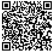
震災ミュージアム アートポリスHP (県建築課)