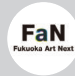
福岡市 経済観光文化局 文化振興部