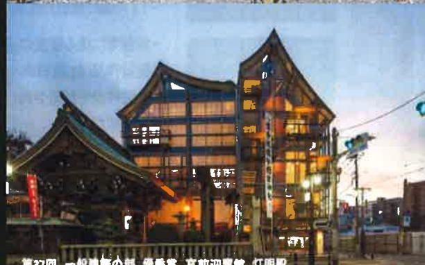
第37回 一般建築の部 優秀賞 宮前迎賓館 灯明殿