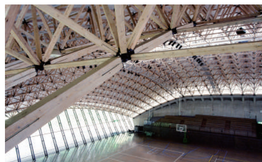
小国町民体育館／竣工 1988 年