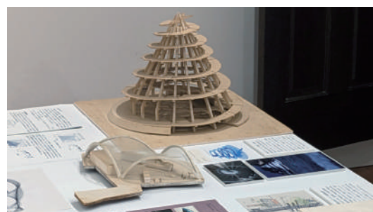
葉祥栄アーカイブの資料群