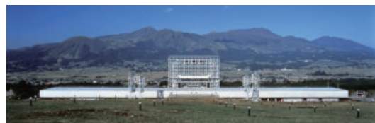
熊本県野外劇場アスペクタ／竣工 1987 年